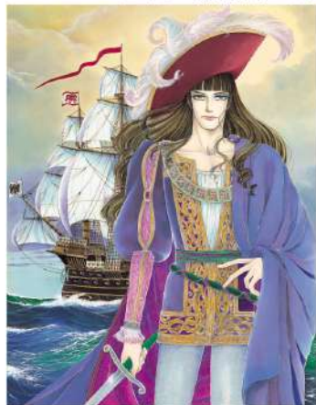
「エル・アルコン-魔-」1978年5月 「プリンセスロマンデラックス青池保子の世界」