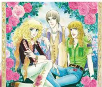
「イブの息子たち」1977年「プリンセス」8月号 扉