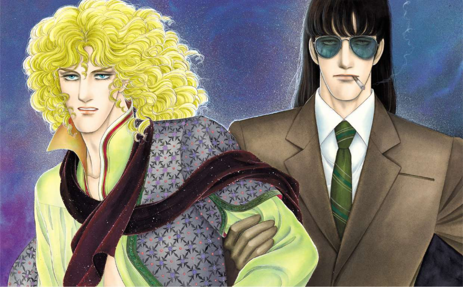
「エロイカより愛をこめて」1982年「プリンセス」5月号 扉

漫 画家の青池保子は、2023年に漫画家生活60周年を迎えました。それを記念して、長年の画業をたどる展覧会を開催します。青池は美術や歴史に関する漫画を数多く描き、独創的なストーリーリーと美しい絵で独自の世界を築いてきました。本展では、デビュー作「さよならナネット」から少女漫画界に衝撃を与えた「イブの息子たち」、大人気作「エロイカより愛をこめて」、中世3部作「アルカサル王城」「修道士ファルコ」「ケルン市警オド」まで、緻密なカラー原画とモノクロ原画、合計300点以上展示します(展示替えあり)。また本会場だけに展示される新たな原画も出品を予定。既成の枠にとられない自由で華麗なる青池ワールドの魅力をご紹介します。